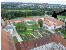
Blick vom Klosterturm zum Klosterareal mit Tenne